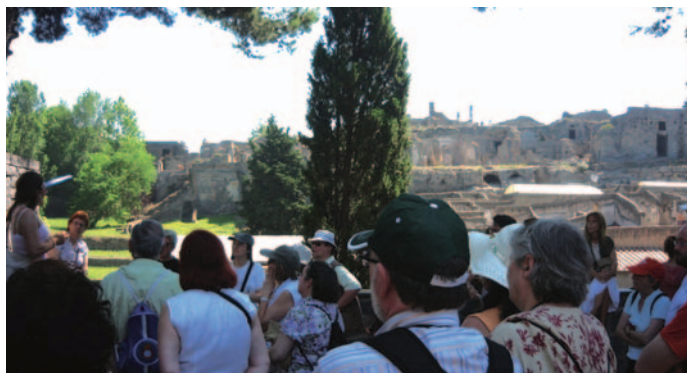
Els Amics a Herclulà

Preu: 20 € (dinar no inclòs). Places limitades.