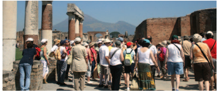
Els Amics a Pompeia