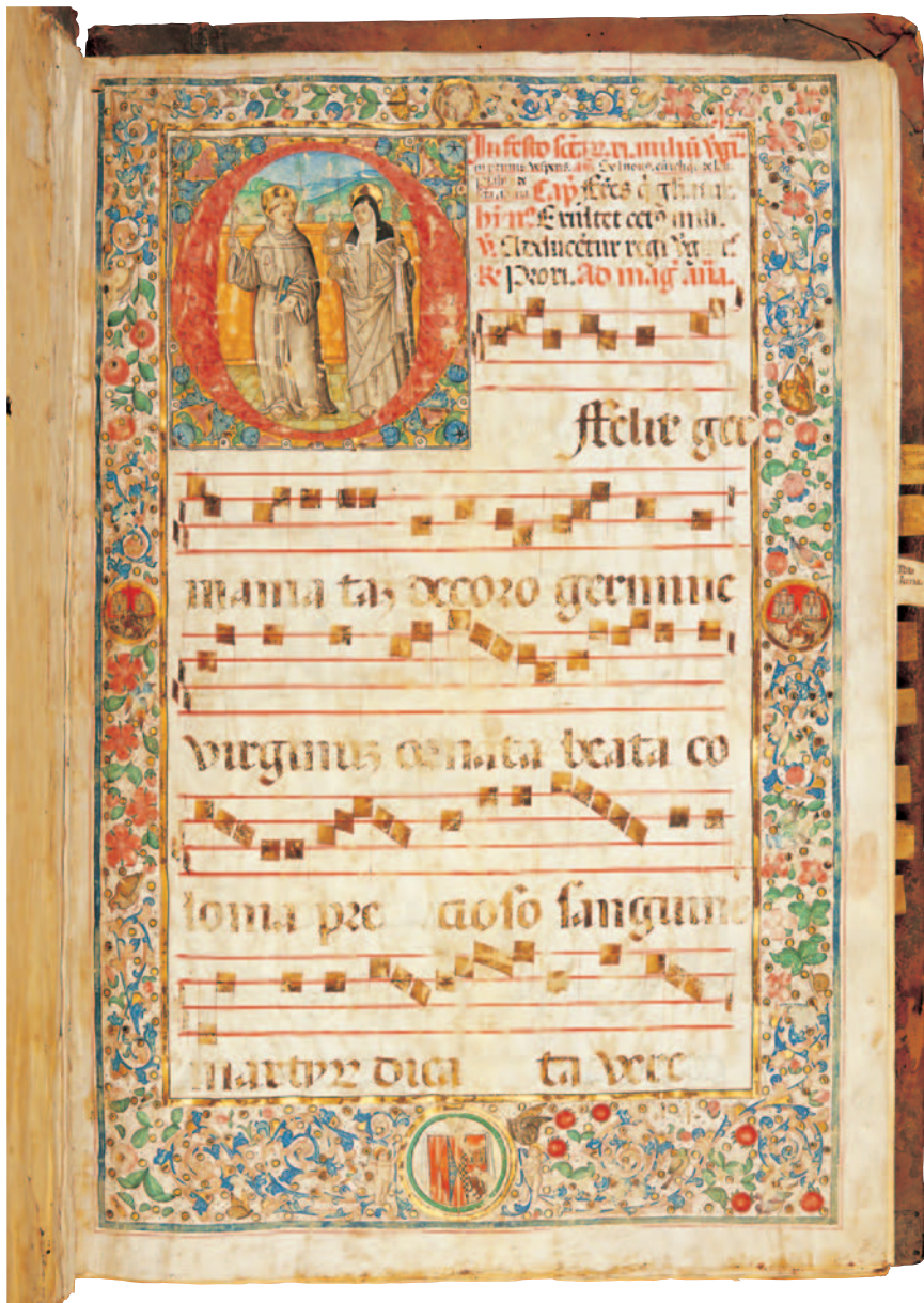
Llibre de cor, Monestir de Pedralbes. La miniatura representa Sant Francesc i Santa Clara.