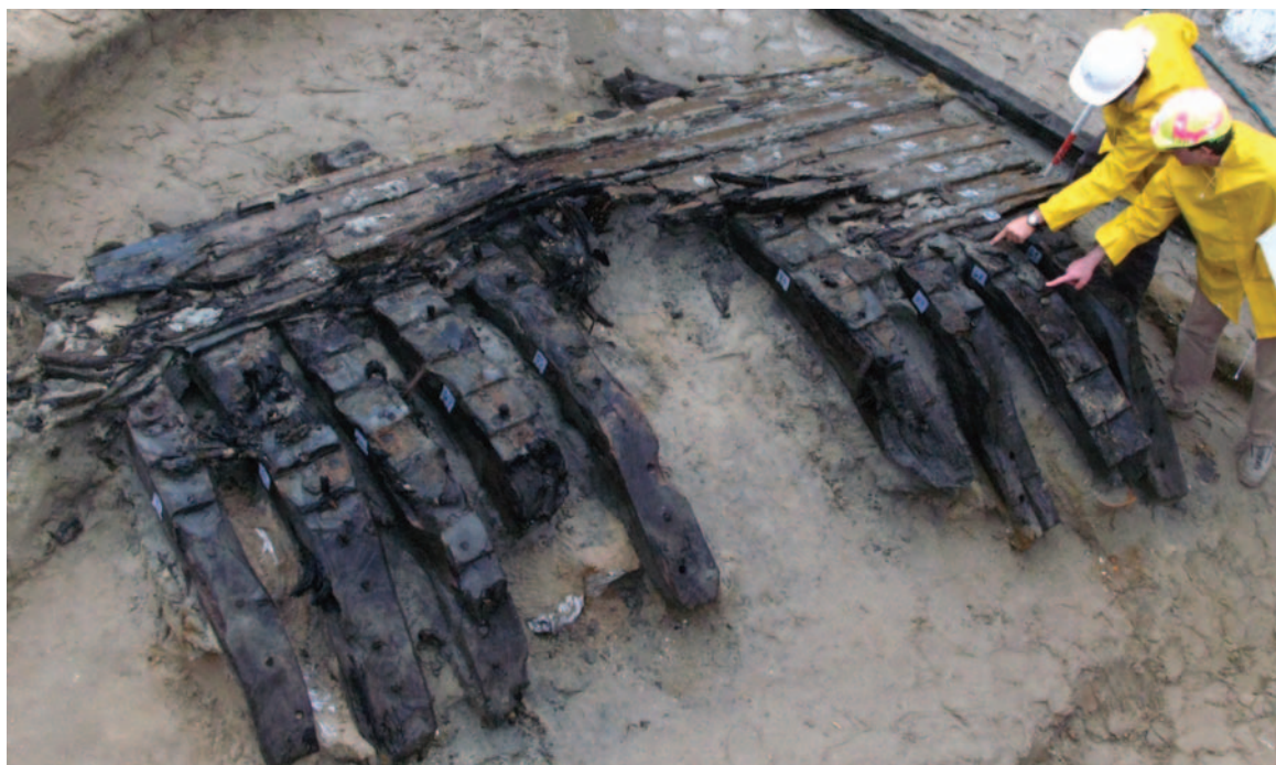
Treballs de documentació del buc del vaixell de la Barceloneta