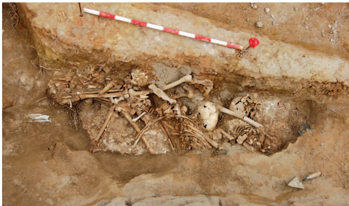
Excavació dels esquelets. S'hi observen les capes de calç.