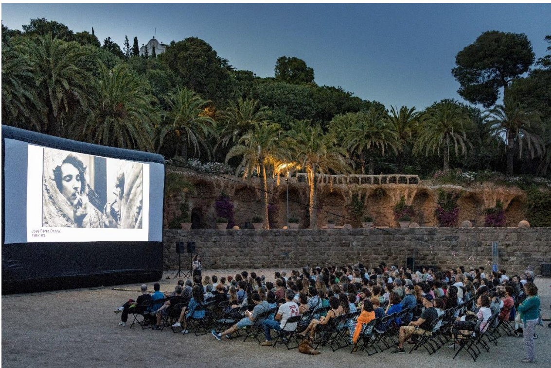
Projecció de la pel·lícula el passat 28 de juny.

La primera pel·lícula de Ventura Pons i sense dubte la més internacional alhora que trencadora. Va ser seleccionada pel Festival de Cannes d'aquell mateix any, el 1978. L'obra retrata la vida de l'artista transvestit José Pérez Ocaña i de la Barcelona de l'època, on encara estava vigent la llei de perillositat social, que reprimia l'homosexualitat. Els carrers de Barcelona i el sorgiment de les lluites pels drets LGTBIQ+ en una ciutat encara marcada per la dictadura.