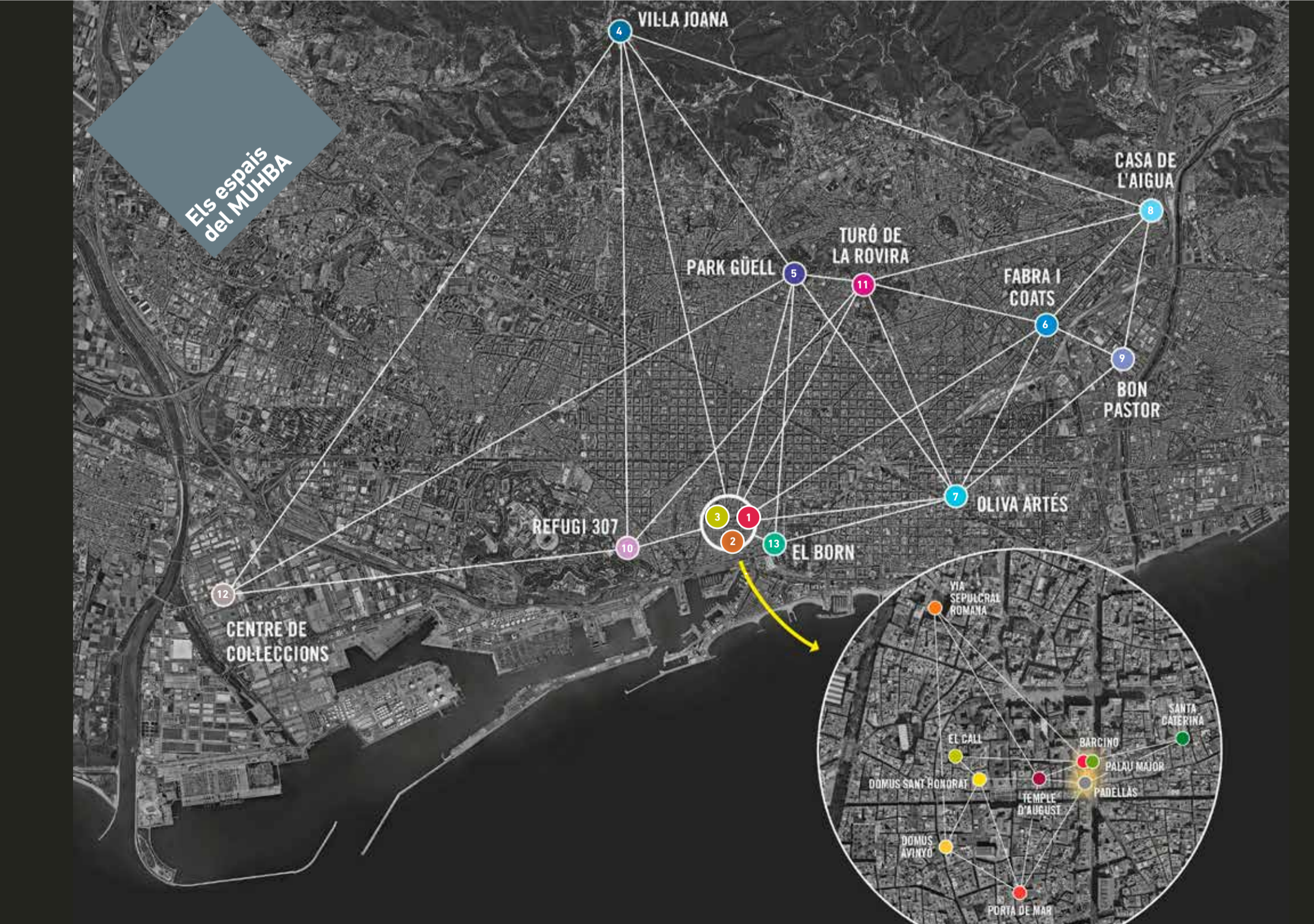
DL B. XXXX-2024

UNA, GRANTED Y LIBRE. ESCENARIS DE LA DICTADURA FRANQUISTA A CIUTAT VELLA Itinerari a càrrec de Josep Grau. Un recorregut per un conjunt d'espais, monuments i memorials del centre de Barcelona relacionats amb el període franquista. Inicis: pl. Catalunya (centre de la plaça) 03/11/2024. D'11.00 a 13.00 h 8 € (Amics: 5,50 €) JOSEP PLA A BARCELONA Ruta que recorre la doble presència de la ciutat en la vida de l'escriptor. Primer, en els anys d'estudiant i periodista de Pla a Barcelona i, després, en el protagonisme de la ciutat dins de la seva obra en escrits com El quadern gris (1966), Barcelona, una discussió entranyable (1956) i Un senyor de Barcelona (1951). A càrrec de Maria Nunes . 10/11/2024. D'11.00 a 13.30 h Inicis: Mallorca, 240 Final: Casa de l'Ardiaca 8,5 € (Amics: 6 €) ELS ESPAIS VERDS DE LA QUADRÍCULA DE CERDÀ A L'ESQUERRA DE L'EIXAMPLE Itinerari d'autor a càrrec de Mireia Teixidó. El recorregut reflexiona sobre el tractat del pla original d'Eixample de Cerdà i el resultat de la densificació de l'edificació i mostra la recuperació d'alguns interiors d'illa. Del passeig de Gràcia, 107 (Davant el Palau Robert), la ruta es dirigeix cap als Jardins de Joan Brossa, seguidament els Jardins d'Elena Maseras, Jardins de l'Antiga Fàbrica Bayer, Jardins de Montserrat i finalitzarem als Jardins de Maria Mercè Marçal. Inicis: passeig de Gràcia, 107 davant del Palau Robert Dissabte 12/10/2024. D'11.00 a 13.00 h. 8 €