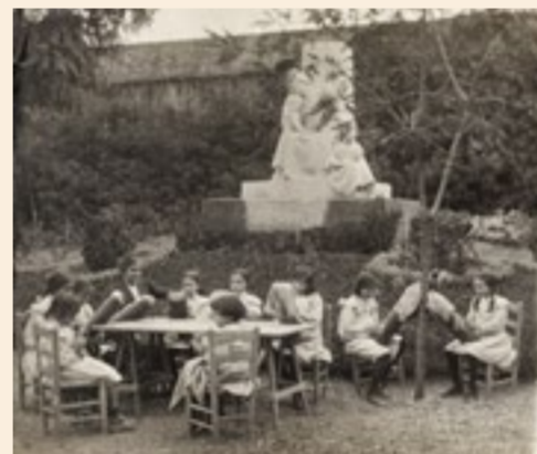
A les escoles a l'aire lliure les classes i les activitats es feien enmig de la natura. Classe de nenes fent puntes de coixí al peu del monument de Josep Llimona.