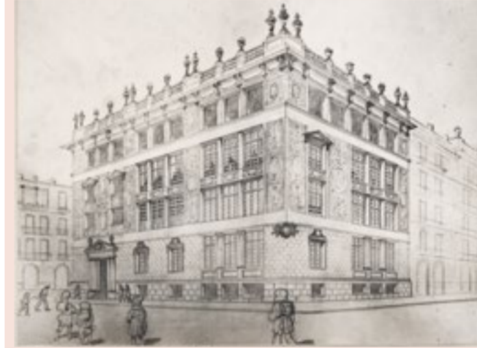
Josep Goday va saber crear un llenguatge propi per als grups escolars monumentals, imatges de la capitalitat catalana i aparadors de la nova política educativa municipal.