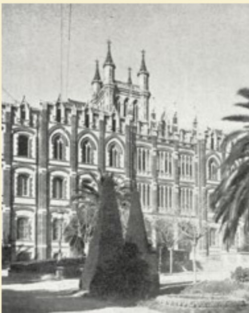
La monumentalitat de les escoles de les congregacions religioses, construïdes a la part alta de la ciutat per arquitectes de renom...