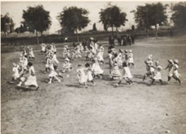
Les colònies escolars municipals per als infants de les escoles públiques amb propensió a les malalties respiratòries tenien una finalitat terapèutica.

Els nens amb propensió a les malalties respiratòries s'educaven amb aquestes iniciatives, la major part del temps fent jocs i activitats a l'aire lliure.