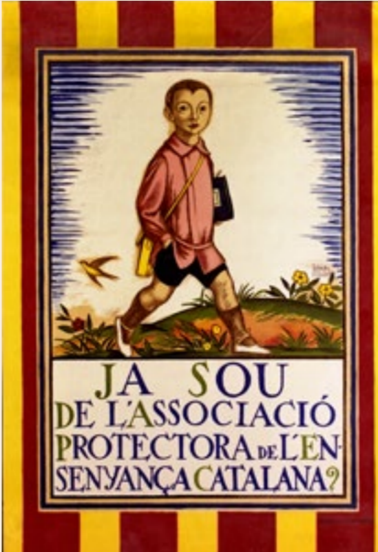
La defensa d'una escola en català i d'un ensenyament racionalista, allunyat dels prejudicis, va sustentar els idearis alternatius a l'escola nacional i a la privada congregacionista a principis de segle. A l'esquerra, cartell de l'Associació Protectora de l'Ensenyança Catalana...