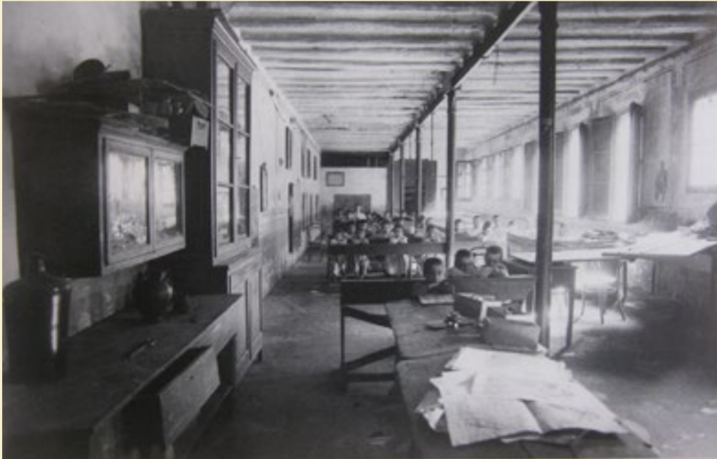
Aula d'una escola unitària. En aquestes aules públiques convivien alumnes de diferents edats a càrrec d'un sol mestre, que era assistit per un ajudant.