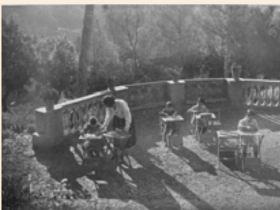
El treball educatiu a l'aire lliure va permetre adaptar mètodes pedagògics moderns a les necessitats educatives especials dels alumnes de Vila Joana.