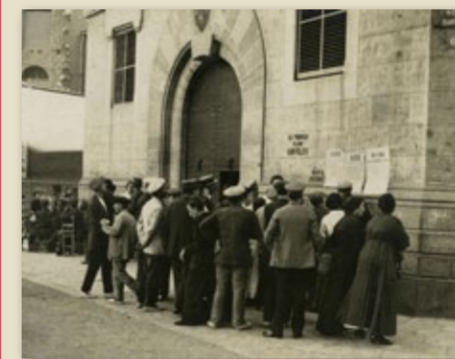
Grup d'homes llegint l'escrit del capità general durant la vaga general, 1917.

D'altra banda, el creixement de les comandes obligaren els industrials a contractar més mà d'obra. Els sindicats van aprofitar aquesta circumstància per pressionar i aconseguir augmentos de salari en benefici dels obrers, amb vagues parcials i localitzades en una sola empresa. Tanmateix, els augments aconseguits no