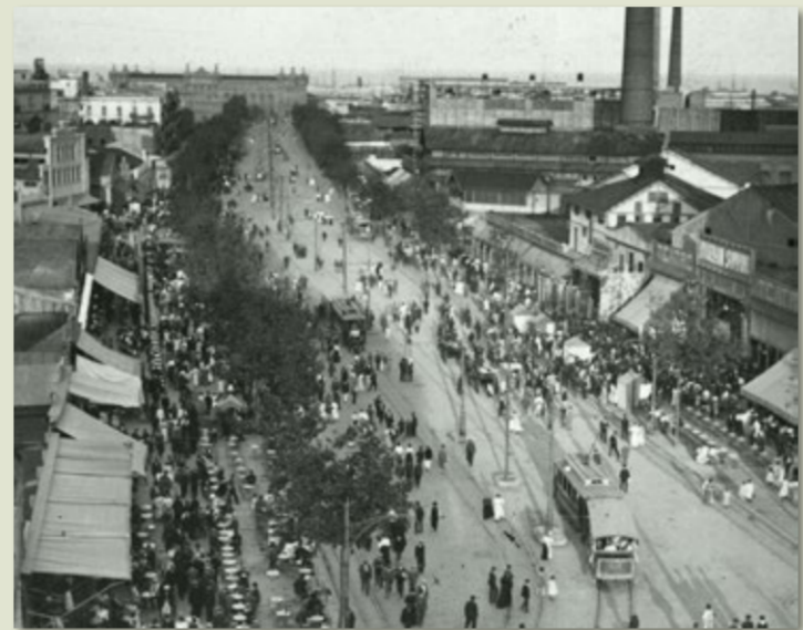
Avinguda Paral·lel, 1913.

d'aquests anys la composició demogràfica, social i econòmica del barri es va tornar més complexa. El Paral·lel ja feia temps que s'havia convertit en l'arteria de les activitats de lleure a Barcelona. Aquesta singularitat es va accentuar amb l'aparició de locals nous i la remodelació dels antics, que van fer proliferar les acadèmies de cant i de ball. Això no vol dir que l'entramat industrial i manufacturer desaparegués, ben al contrari. Cal tenir en compte que, en aquests anys, la indústria tèxtil anava perdent pes en el conjunt del teixit productiu de Catalunya enfront d'altres manufactures que van contribuir a diversificar molt el paisatge industrial del districte, en particular, i de Barcelona, en general. Així doncs, hi trobarem una gran varietat de fàbriques de sabó, de pasta, foneríes, destil·leries de begudes alcohòliques, entre d'altres, i també, cal dir-ho, la central elèctrica situada al Paral·lel. Els espais alliberats per indústries i vapors que marxaren del Raval per buscar sòl a bon preu es van convertir en espais mixtos, on els baixos, i de vegades els entresols, eren ocupats per indústries i tallers de tota mena, i els pisos de les altres plantes eren llogats i rellogats principalment a famílies treballadores.