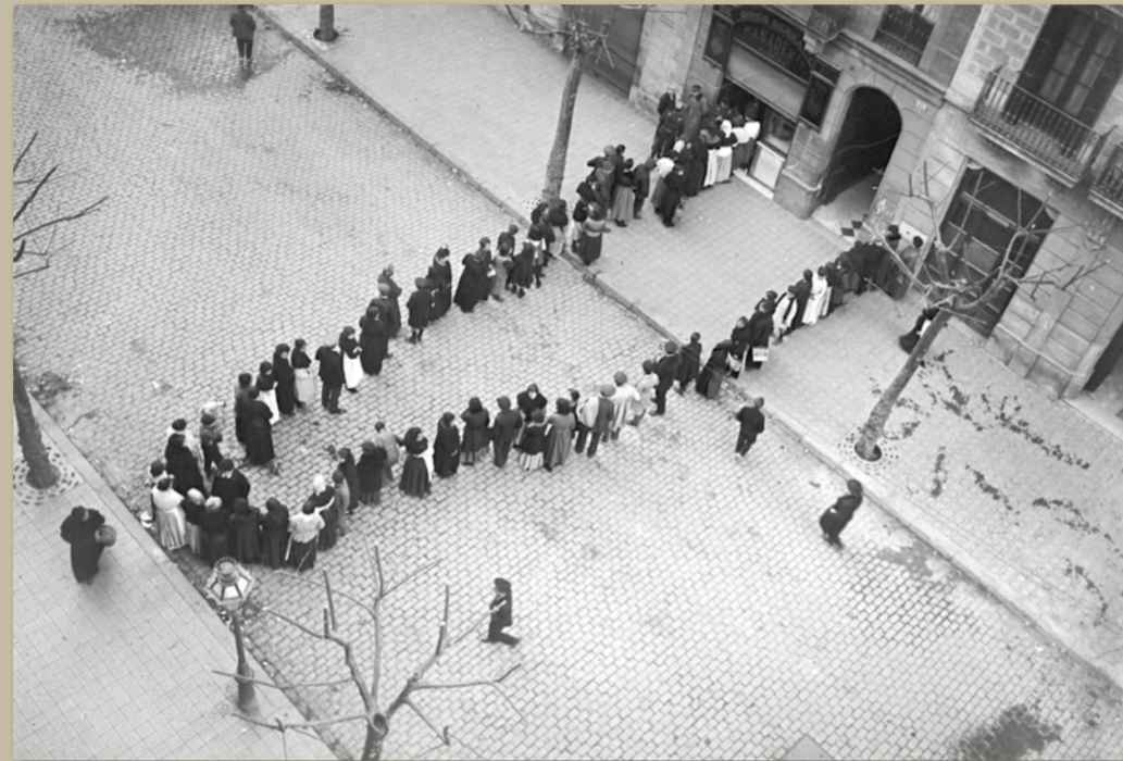
Cua davant la fleca Aurora, gener de 1918.

laboral, després que l'empresa hagués rebaixat arbitràriament el salari dels treballadors que ocupaven algunes categories professionals, i hagués despatxat els obrers que havien destacat en la protesta contra aquesta decisió. A banda d'això, la CNT també volia aconseguir, de passada, la jornada laboral universal de 8 hores, un objectiu llargament perseguit per la classe obrera —de fet, ja hi havia sectors que hi havien reeixit i havien introduït aquesta jornada.