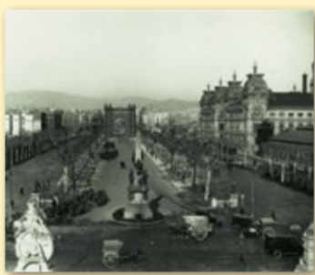
El Globo Cautivo, primer edifici a la dreta, 1930-1935.

cala on s'estaven va cedir i moltes en van resultar ferides. Les exigències es van radicalitzar i van adquirir un to més reivindicatiu de lluita de classes: ja no es demanava el preu de taxa, es volia que els preus tornessin a ser com els d'abans de la guerra. Alhora, el diari cenetista Solidaridad Obrera justificava que s'agafessin les mercaderies sense pagar-les. A partir del dia 13 la Guàrdia Civil s'aquartera.