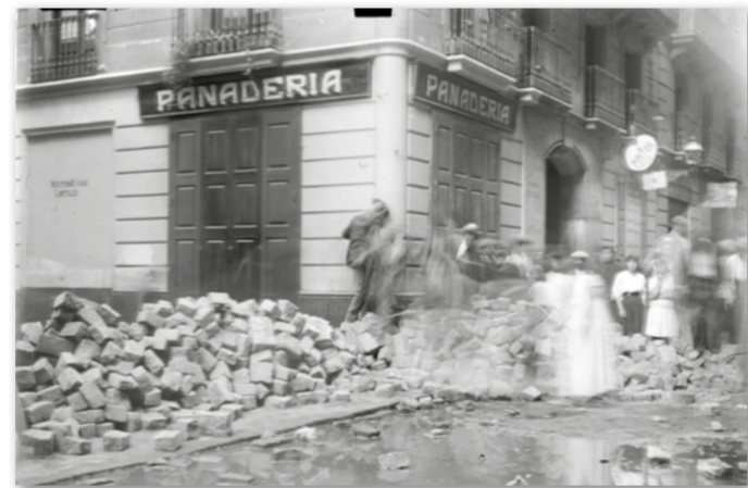
Barricada al carrer de la Cadena, 1917. Josep M. Sagarra i Plana. ANC

febrer de 1918; en canvi, el poble, més desemparat, es va haver de proveir de menjar a la Creu Roja, perquè no havia treballat i no havia cobrat.