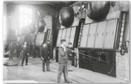
Fogoners del cuirassat Alfons XIII a la central del carrer Mata, 1919. Josep M. de Sagarra. ANC

Carles Montañés, de posar en llibertat immediata tots els obrers empresonats sense delictes de sang. A la fi del conflicte es oficiar una missa de campanya a la plaça de Catalunya, cosa que demostra la impressió que la vaga va fer a les forces conservadores. Tanmateix, 48 hores després, això no s'havia completat, i el dia 24 de març es va declarar una vaga general que duraria fins al 7 d'abril.