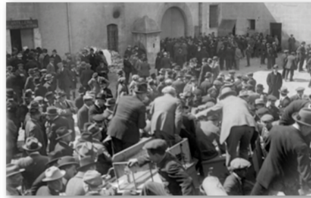
Lliurament d'armes al sometent a les Drassanes, 1919. Josep Branguli. ANC