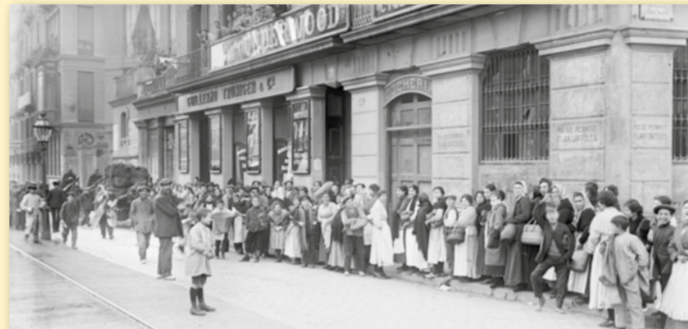
Gua davant una carboneria, al carrer de Balmes, pel conflicte de carestia de subsistències, 1918.

La reivindicació inicial va ser contra el cost del carbó: volien que es fixés un preu de taxa, és a dir, un preu màxim per al carbó i els productes de primera necessitat, i que no s'estafés ni en el pes ni en la qualitat. L'endemà, s'afegiren a la demanda la resta de productes bàsics, incloent-hi els preus dels lloguers. A Barcelona, ja el 1915, havia començat a funcionar una Junta de Subsistències que establia els preus dels productes de primera necessitat, però ni els comerciants, ni tampoc les autoritats, no en respectaven les resolucions.