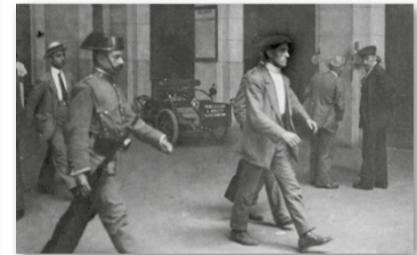
Detingut a l'Estació del Nord, 16 agost 1917.

La campanya per alliberar el comitè de vaga socialista va portar a una manifestació pro amnistia al desembre. Els socialistes sortirien de la presó en ser escollits diputats el