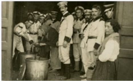
La Creu Roja repartint menjar, 17 agost 1917.