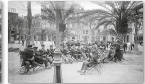
Forces militars vigilant la ciutat, 26 de març de 1919.

empleats de facturació de la central del Paral·lel, els quals van respondre amb una protesta. Se'n van acomiadar sis. Per solidaritat amb aquests treballadors, a partir del 5 de febrer s'hi van anar sumant la resta d'empleats i, durant els dies següents, es van afegir a l'aturada altres seccions i altres empreses del ram. Quan la vaga va afectar la plantilla de la sala de producció d'energia, l'empresa va ser milloritzada. Aleshores els treballadors es van presentar a la feina però sense treballar: 3.000 foren empresonats al Castell de Montjuïc. La vaga es va estendre a la resta d'empreses fins que la ciutat va quedar paralitzada. El fet clau va ser quan, el dia 17, es va aturar tot el sector