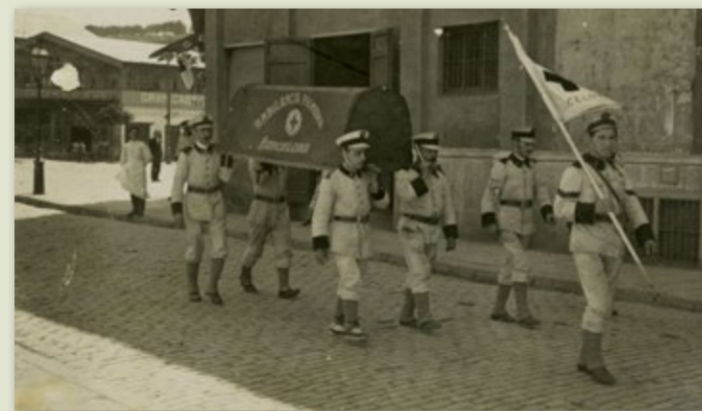
La Creu Roja traslladant un malalt durant la vaga general del 1917. Alexandre Merletti (IEFC). AFB

abandonat els barris del centre per anar a establir-se a alguns dels municipis que s'acabaven d'incorporar a la capital catalana, com ara Sants o Sant Martí de Provençals, el Poble Nou (la Manchester catalana) i la Barceloneta. Els habitatges dels obrers, de millor o pitjor qualitat, van anar creixent a recer dels grans establiments industrials. Els barris nous, que sovint coincidien amb els últims pobles agregats a la capital catalana, eren centres amb una vida associativa animada. Són els anys d'or per a les cooperatives i les societats culturals i recreatives de tota mena i, per descomptat, estan marcats per una intensa vida sindical.