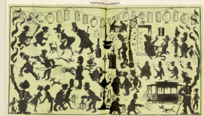
La manca d'electricitat durant la vaga de La Canadenca va ser objecte de burla en algunes revistes de l'època. L'Esquella de la Torratxa, 2095 (28 de febrer de 1919), pàg. 125. AHCB

El sindicat de ram o d'indústria va ser posat a prova a la vaga de La Canadenca. Les raons directes que van motivar aquesta vaga van ser la solidaritat entre els obrers i el manteniment de les condicions