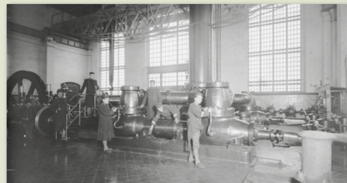
Militars vigilant Aigües de Barcelona, 1919. Josep Brangulí. ANC

La Barcelona d'aleshores era en plena transformació, amb canvis substancials en el pla urbà, després de l'ocupació de l'Eixample, i també en l'àmbit social i econòmic. En el terreny socioeconòmic la ciutat s'havia transformat amb l'enderrocament de les antigues muralles, un procés que es va perllongar diverses dècades. Les grans fàbriques i empreses havien