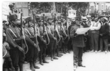
Militar llegint el ban de guerra, 13 agost 1917. Branguli. ANC

Ara bé, els sindicalistes no van anar sols en aquesta nova convocatòria. Els esdeveniments polítics nacionals i internacionals van fer que s'apleguessin forces republicanes amb diferents sensibilitats, com ara el Partit Republicà Català, la Unió Republicana i el Partit Radical, a més d'Estat Català, el partit fundat per Francesc Macià, que hi va afegir demandes de caire polític amb l'esperança de posar fi a la monarquia.