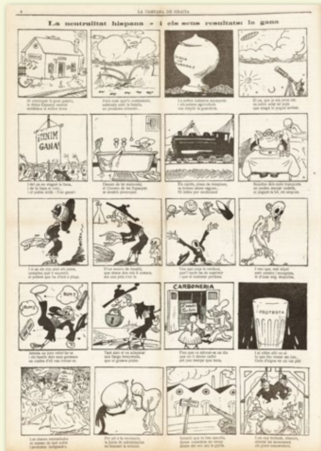
Auca satírica sobre les conseqüències de la Primera Guerra Mundial a Espanya. La Campana de Gràcia, 2546 (19 de gener de 1918), pàg. 4.

La majoria de nouvinguts que cercaven feina s'instal·laren al barri. Això passava mentre el parc d'habitatges es va mantenir pràcticament igual al llarg de tot el període. El resultat d'aquest desequilibri va ser una densificació demogràfica fins a límits gairebé insostenibles de prop de 1000 habitants per hectàrea.