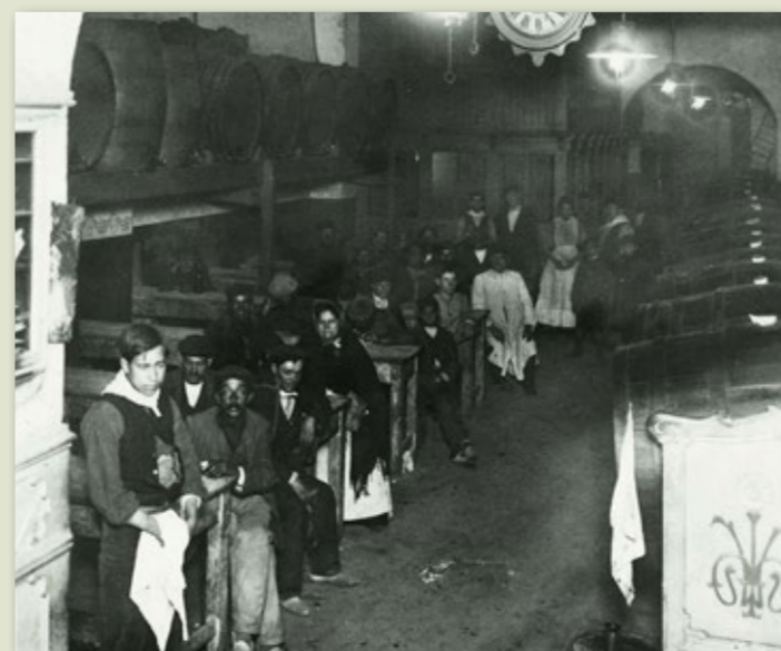
Taverna La Mina al carrer Trenta Claus, 1913.

En aquells anys els productes autòctons (tant de la indústria agrícola o metal·lúrgica, com els productes manufacturats, entre els quals hi havia la roba, el calçat, etc.), i també l'armament, atès que moltes foneríes havien reconvergit la producció, van aconseguir en els mercats internacionals preus molt per sobre dels que hi havia al mercat nacional. Per aquesta raó, sobretot, la majoria de mercaderies van anar a parar fora d'Espanya i, per tant, la població del país va passar per situacions de carestia similars a les que hi van haver als països en guerra. És cert que la necessitat de mà d'obra va propiciar l'augment dels jornals, però aquests salaris més alts no van arribar a compensar mai la pujada de preu dels productes bàsics. L'arribada massiva d'immigrants va disparar la demanda d'habitatge i, en conseqüència, els preus de les habitacions i dels allotjaments. Els lloguers van experimentar un augment exponencial, molt més accentuat als barris obrers que als barris benestants.