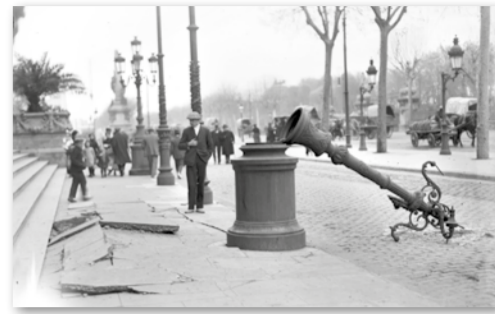
Conseqüències dels aldarulls, 1919. Josep M. Sagarra. ANC

sabia qui representava el comitè de vaga. Finalment, amb Salvador Seguí al capdavant, van ser alliberats, com a gest governamental per procurar que els obrers abandonessin la vaga. Poques hores més tard,