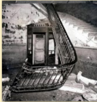
Escala del Govern Civil malmesa per les manifestants, 17 gener 1918.

Les mobilitzades maldaven perquè la protesta fos femenina, però alhora transversal, és a dir que hi haguessin dones de totes les condicions i classes socials. Les manifestants van entrar als tallers i als cabarets i obligaren les dones que hi trobaven a unir-se a la revolta. També ho van fer amb dones burgeses a qui feien sortir de tramvies i cotxes.