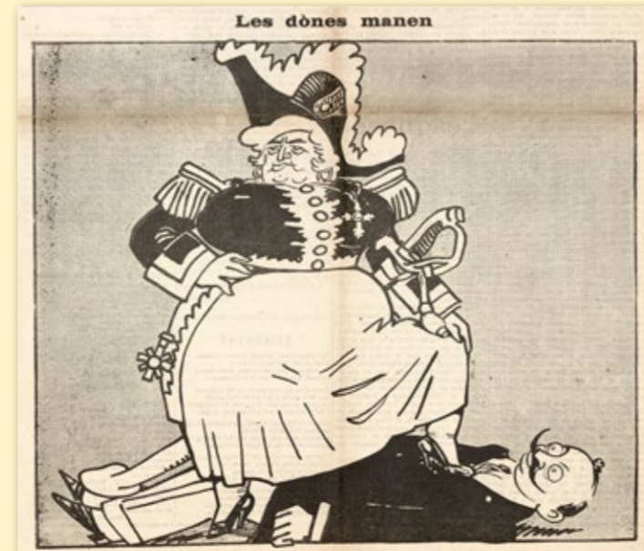
Acudit satíric que representa la força de les dones a la vaga de 1918. La Campana de Gràcia, 2547 (26 de gener de 1918), pàg. 1.