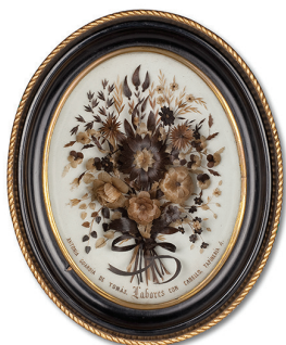
Labor de cabell, mitjan segle XIX. Museu Frederic Marès.