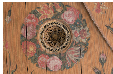
Clavicèmbal, MDMB 420.