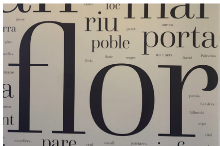
Detall del núvol de paraules de Verdaguer al MUHBA Vil·la Joana