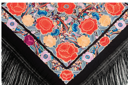
Mantó de Manila. Xina, primer quart del segle xx.