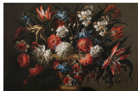
Juan de Arellano, Cistella de flors , c. 1670. Museu Nacional d'Art de Catalunya, dipòsit temporal de col·leccionista privat, 2014