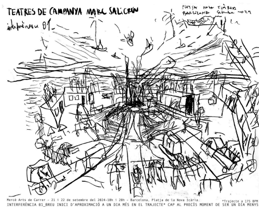
Mercè Arts de Carrer - 22 i 23 de setembre del 2024-20h i 20h - Barcelona, Platja de la Nova Icària. *INTERFERÈNCIA 01 BREU INICI D'APROXIMACIÓ A UN DIA MÉS EN EL TRAJECTE* CAP AL PRECIS MOMENT DE SER UN DIA MENYS.

Entre els artistes destaca la participació de noms reconeguts i icònics del panorama musical de la ciutat, com Miqui Puig, Lolo & Suzaku, Frames Percussion i Neus Borrell . Pel que fa a entitats col·laboradores destaquen el Centre Cívic Barceloneta, Escola Municipal de Música Can Fargues, o el Grup Gimnasia Espigó Bogatell. El valor d'aquesta proposta, per tant, és que sota un mateix paraigües s'han unit entitats i artistes diversos per a la creació d'un 'concert de ciutat' experimental i caòtic a la costa de Barcelona: naumàquia sonora de sirenes i pirotècnia, brigades municipals, avisos de megafonia a peu de platja, pregons a