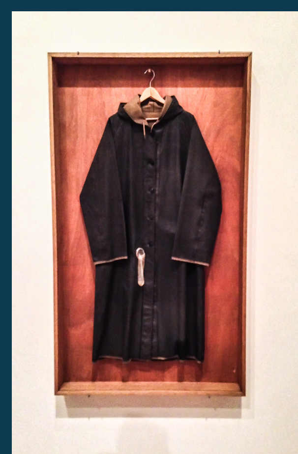
Safe Sex, Ai Weiwei, 1986 (De Fabebk - Trabajo propio, CC BY-SA 3.0, https://commons.wikimedia.org/w/index.php?curid=33695014 )