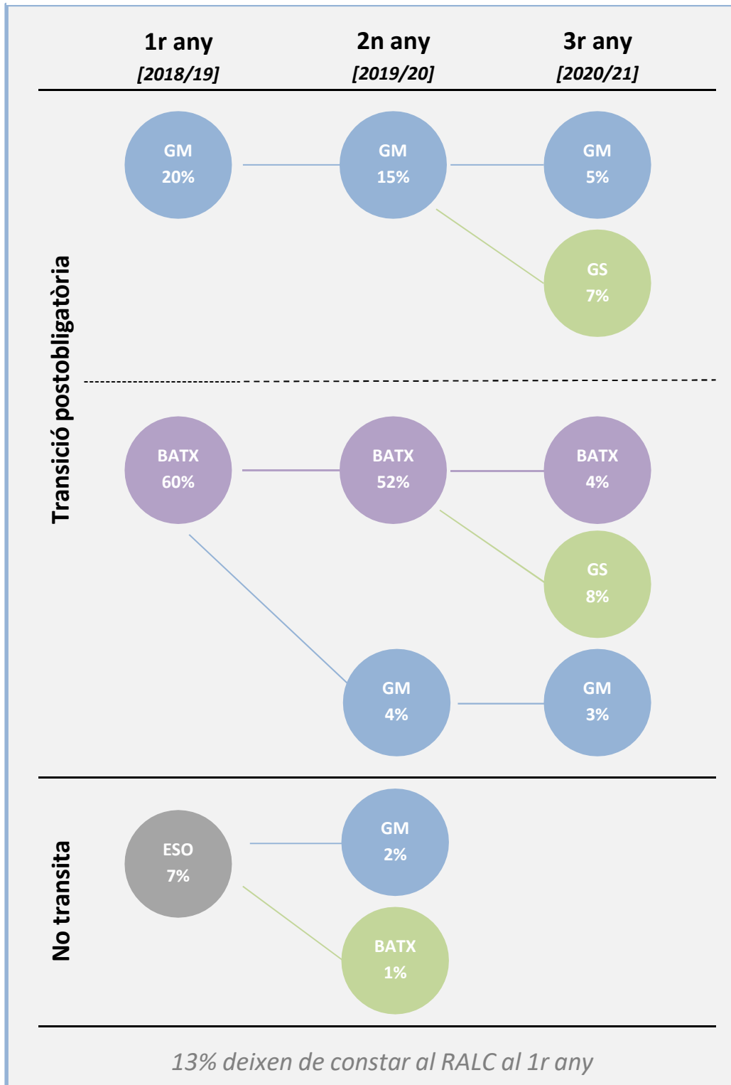
Il·lustració 2 Itineraris educatius: probabilitats més freqüents des de 4rt d'ESO en estudis postobligatoris no universitaris. (on 100% = tots el col·lectiu d'individus que cursaven 4rt d'ESO al curs 2017-2018)