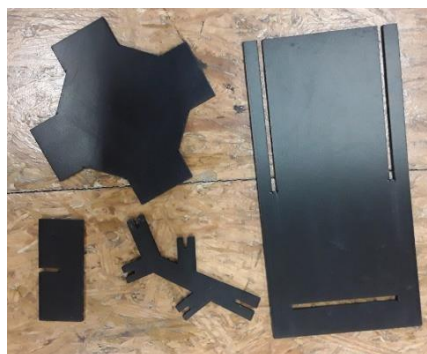
Peces de muntatge