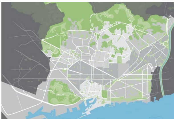
Mapa de gran format