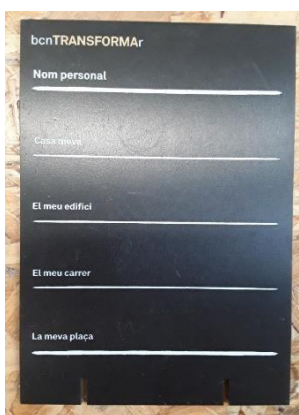
Fitxa de valoració dels espais