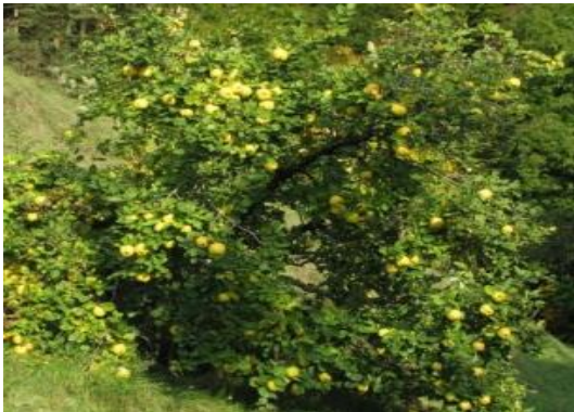
Codonyer Cydonia oblonga

Tipus: herbàcia Floració: estiu tardor Reg: baix o moderat Insolació: sol o mitja ombra