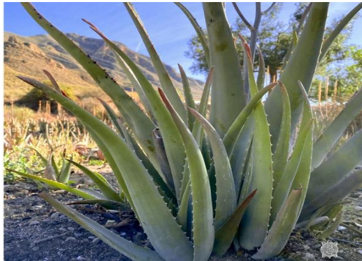
Àloe Aloe vera

Tipus: arbori Floració: primavera Reg: moderat Insolació: sol o mitja ombra