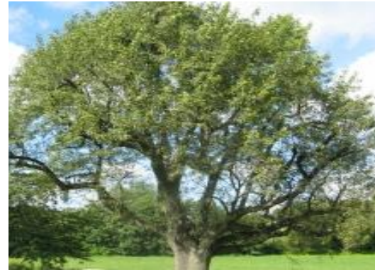
Servera Sorbus domestica

Tipus: arbori Floració: - Reg: baix o moderat Insolació: sol o mitja ombra