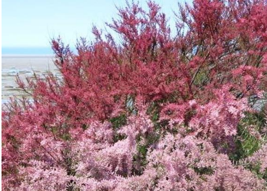
Tamariu Tamarix gallica

Tipus: arbustiva Floració: primavera Reg: moderat o alt Insolació: sol o mitja ombra