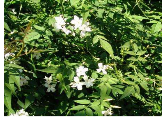
Gessamí comú Jasminum officinalis

Tipus: arbori fruiter Floració: primavera Reg: moderat Insolació: sol