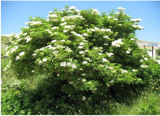
Saüc Sambucus nigra

Tipus: arbustiva Floració: primavera Reg: baix o moderat Insolació: sol o mitja ombra