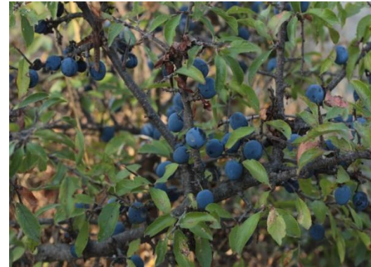
Aranyoner Prunus spinosa

Tipus: arbustiva Floració: hivern Reg: moderat Insolació: sol o mitja ombra