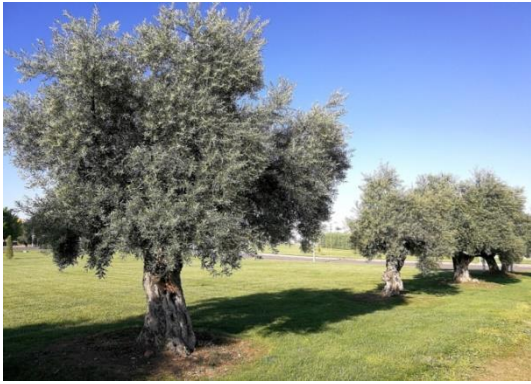
Olivera Olea europaea

Tipus: enfiladissa Floració: primavera Reg: moderat Insolació: sol