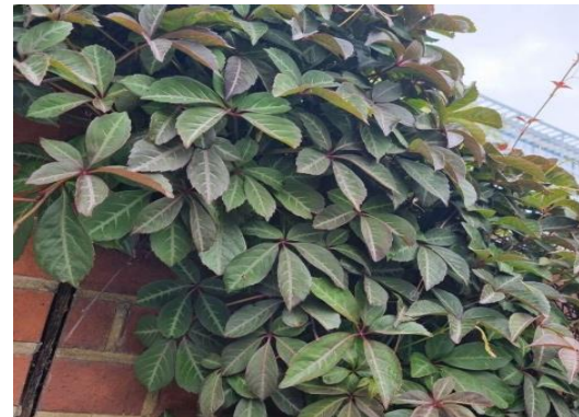
Vinya verge Parthenocissus henryana

Tipus: arbustiu - arbori Floració: primavera estiu Reg: moderat o alt Insolació: sol o mitja ombra