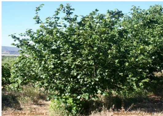
Avellaner Corylus avellana

Tipus: arbustiva Floració: hivern primavera Reg: baix Insolació: sol