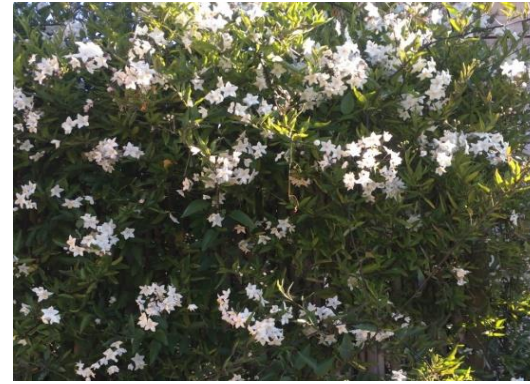
Gessamí fals Solanum jazminoides

Tipus: arbori fruiter Floració: primavera Reg: baix o moderat Insolació: sol