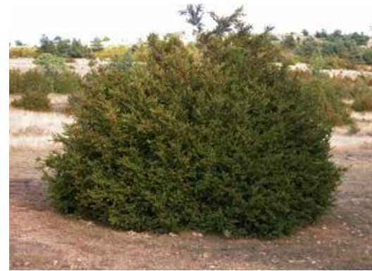
Boix Buxus sempervirens

Tipus: arbustiva Floració: primavera Reg: baix Insolació: sol