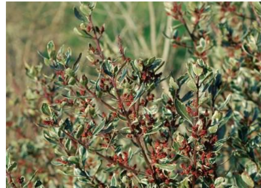
Aladern Rhamnus alaternus

Tipus: herbàcia suculenta Floració: estiu Reg: baix Insolació: sol o mitja ombra