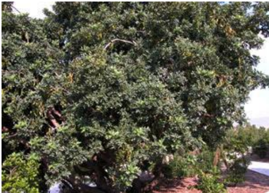
Garrofer Ceratonia siliqua

Tipus: arbustiva enfiladissa Floració: estiu Reg: baix o moderat Insolació: sol