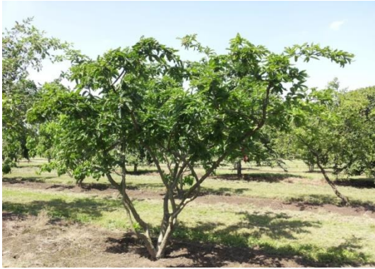
Nesprer Mespilus germanica

Tipus: arbori fruiter Floració: primavera Reg: moderat Insolació: sol