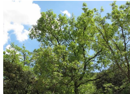
Roure cerrioide Quercus x cerrioides

Tipus: arbori fruiter Floració: primavera Reg: moderat Insolació: sol