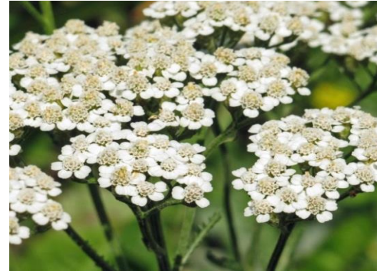
Milfulles Achillea millefolium

Tipus: arbustiva Floració: estiu Reg: baix o moderat Insolació: sol