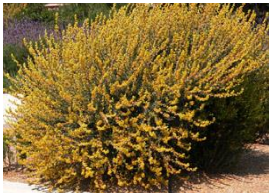
Botja blanca Anthyllis cytisoides

Tipus: arbustiva Floració: primavera Reg: baix Insolació: sol