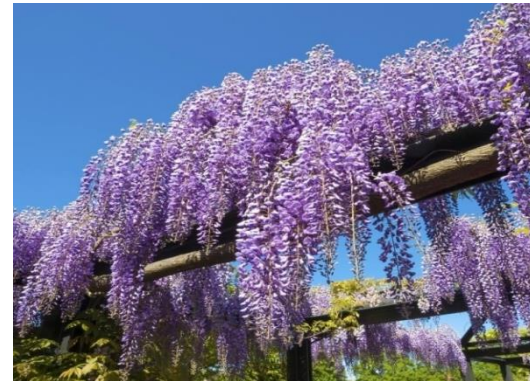
Glicina Wisteria sinensis

Tipus: arbori - arbustiu Floració: - Reg: baix o moderat Insolació: sol