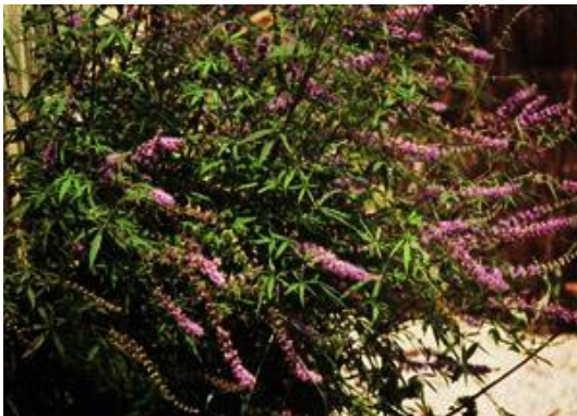
Aloc Vitex agnus-castus

Tipus: arbustiva Floració: - Reg: baix o moderat Insolació: sol o mitja ombra