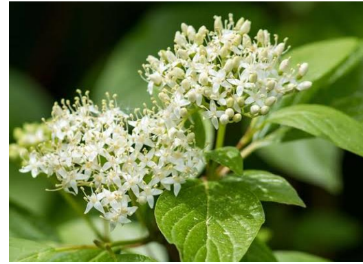
Sanguinyol Cornus sanguinea

Tipus: arbustiva Floració: primavera Reg: baix o moderat Insolació: sol o mitja ombra