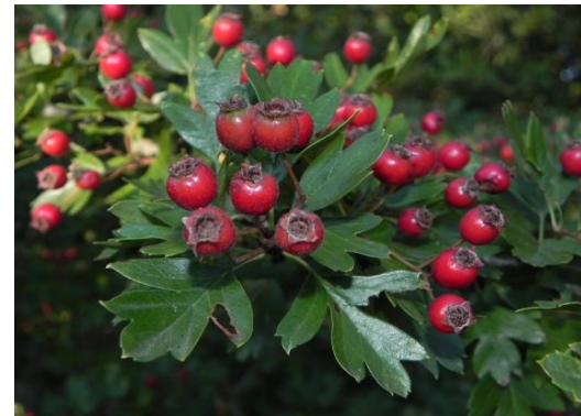
Arç blanc Crataegus monogyna

Tipus: arbustiva Floració: hivern primavera Reg: moderat o alt Insolació: sol o mitja ombra