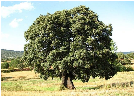
Alzina Quercus ilex

Tipus: arbori Floració: - Reg: baix o moderat Insolació: sol o mitja ombra