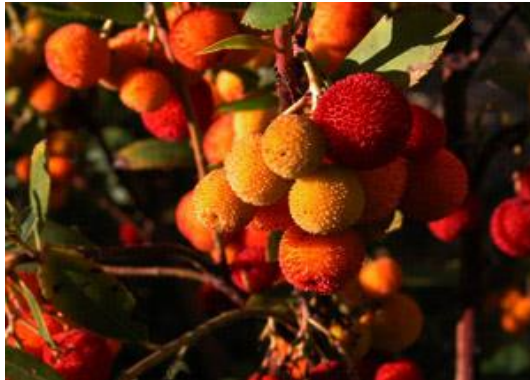
Arboç Arbutus unedo

Tipus: arbustiva Floració: primavera Reg: moderat Insolació: mitja ombra