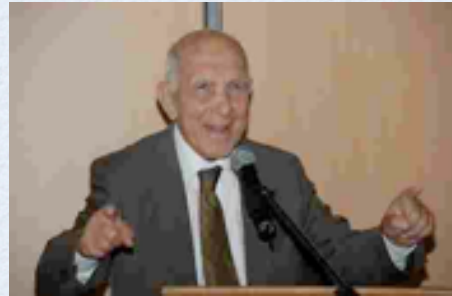
Stéphane Hessel Indignaos !! Comprometeos !