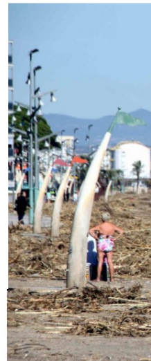
La Mediterrània és u