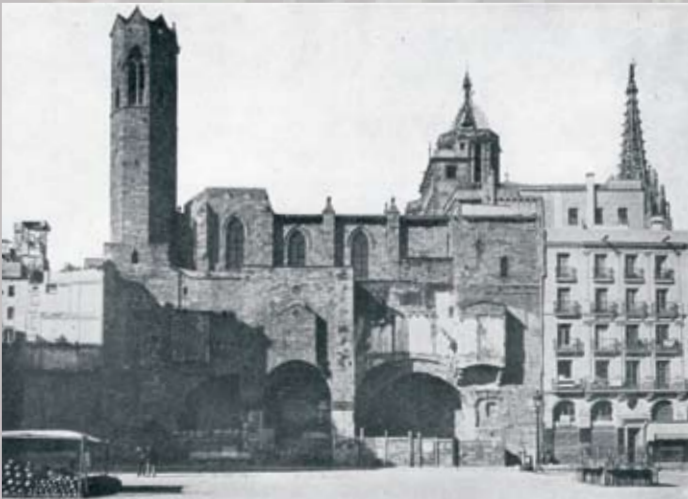
Foto de la Plaça Ramon Berenguer el Gran publicada a Nombre, extensión y política del "Barrio gótico", publicació de l'Ajuntament de Barcelona preparada per Adolf Florensa (s.d.).