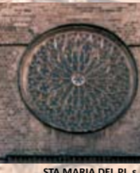
STA MARIA DEL PI, s. XIV Pl. del Pi, 7 B. Mas i altres