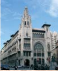
CAIXA DE PENSIONS Neogòtic, 1917 Via Laietana, 56-58 E. Sagnier