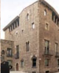
CASA CLARIANA PADELLÀS, s. XV-XVI C/ del Vèguer, 4 (MUHBA) Trasllada des del c/ Mercaders en la dècada de 1930