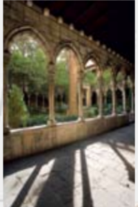
SANTA ANNA Parts gòtiques, s. XII-XV Pl. de Ramon Amadeu, 3