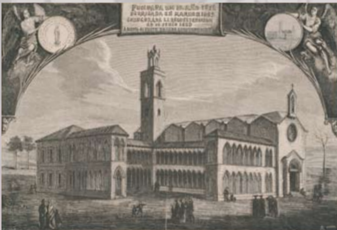
Dibuix commemoratiu del trasllat i la reconstrucció de l'antic Monestir de Jonqueres en la seva nova ubicació a l'Eixample (1869-1873), on la reconstrucció que es mostra no es correspon amb la realitat.

A Barcelona hi ha alguns edificis de fundacions anteriors al segle XIII que tenen algunes parts gòtiques (com Sant Pere de les Puelles, fundat al segle X, o la col·legiata de Santa Anna, del darrer quart del segle XII). Però en aquests edificis els elements gòtics són ja dels segles XIV o XV. Els convents de Santa Caterina (dominics) i de Sant Francesc (franciscans), actualment desapareguts, van ser fundats durant el segon quart del segle XIII, i per això se'ls ha considerat com les primeres construccions genuïnament gòtiques de Catalunya. La llarga i complexa intervenció arqueològica al mercat de Santa Caterina va permetre comprovar que aquest plantejament era erroni. La localització d'una primera església dominica de planta basilical amb una testera amb tres absis marca amb claredat la persistència de les maneres de fer del romànic. Així ho posa de manifest la mena de restes visibles a l'Espai Santa Caterina del MUHBA. Aquesta primera església dominica va ser refeta en el decurs del segle XIV, amb una proposta plenament gòtica.