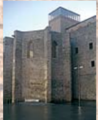
CAPELLA DEL PEU DE LA CREU s. XV-XVI C/ dels Àngels, 5 i 6