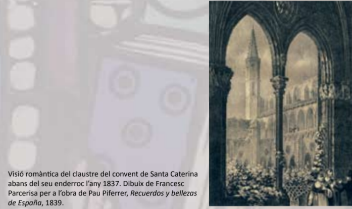
Visió romàntica del claustre del convent de Santa Caterina abans del seu enderroc l'any 1837. Dibruix de Francesc Parcerisa per a l'obra de Pau Piferrer, Recuerdos y bellezas de España , 1839.