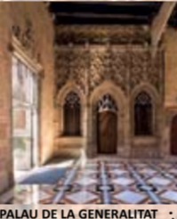
PALAU DE LA GENERALITAT s. XV-XVI Pl. de Sant Jaume, 4