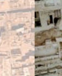
SANTA CATERINA, s. XIII Pl. de Joan Capri (MUHBA) Restes arqueològiques