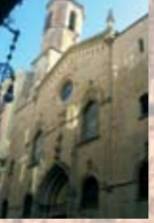
ESGLÉSIA DE ST. JAUME (antiga església de la Trinitat) s. XV C/ de Ferran, 28 Restauració de la portalada el 1878.