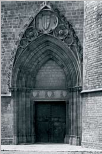
Portalada de l'església del Monestir de Pedralbes (1317).