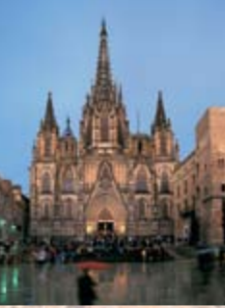
CATEDRAL, s. XIII-XV J. Fabre, B. Roca, A. Barquès i altres. Façana neogòtica construïda entre el 1887 i el 1913