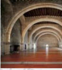
SALÓ DEL TINELL (Palau Reial Major) s. XIV Pl. del Rei, 7-9 G. Carbonell