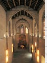
SANTA ÀGATA, (Palau Reial Major) s. XIV Pl. del Rei, 10 B. Riquer