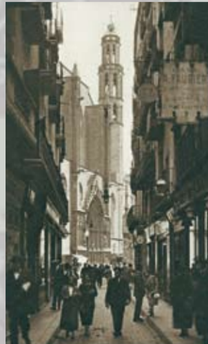
Santa Maria del Mar vista des del carrer de l'Argenteria.