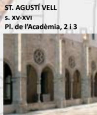
ST. AGUSTÍ VELL s. XV-XVI Pl. de l'Acadèmia, 2 i 3