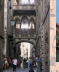
PONT DEL CALL DEL BISBE Neogòtic, construït el 1928 J. Rubió i Bellver