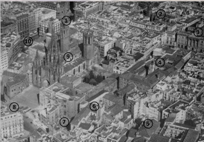
Llegenda de la fotografia: 1. Plaça del Àngel, 2. Iglesia de San Justo, 3. Ayuntamiento, 4. Diputación Provincial, 5. Iglesia de San Felipe, 6. Palacio Episcopal, 7. Plaza Nueva, 8. Avenida de la Catedral, 9. Catedral, 10. Plaza de Berenguer el Grande. Foto aèria del "Barri Gòtic" publicada a Nombre, extensión política del "Barrio gótico", publicació de l'Ajuntament de Barcelona preparada per Adolf Florensa (s.d.).